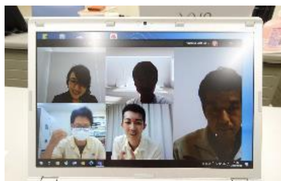
グループワーク(グループ2:メンバーによる活発な議論)

(9) それぞれのグループからの発表後、他のグループの発表の優れていた点について、グループワークを行いました。10分程度のワークの後、ゼミナール編チームに戻って、他のチームの優れた点について、検討結果を発表しました。