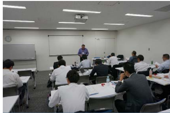
熱心に話を聞く受講者