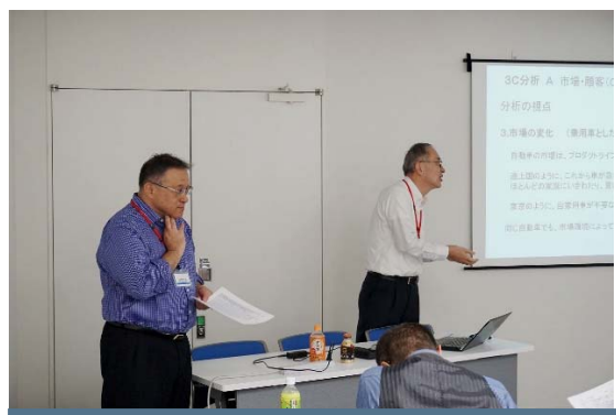
講師陣による補足説明