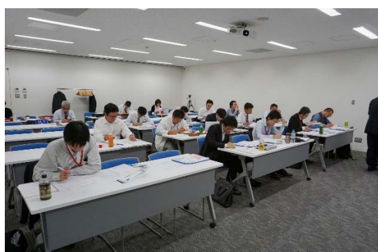
受講者のみなさん