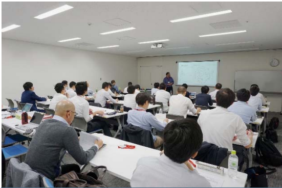
受講者のみなさん