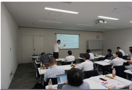
岡田講師による説明