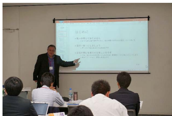
この講座の目指すところの説明