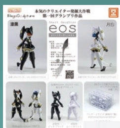
Smart daughter / eos (エオス)

©JMRP ©NZ INDUSTRIAL ©MegaSculpture ©mo72