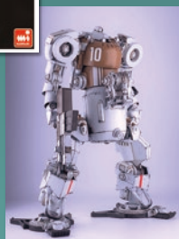
人型重機シリーズ

©JMRP ©NZ INDUSTRIAL ©MegaSculpture ©mo72