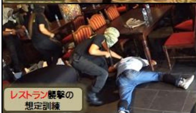
レストラン襲撃の 想定訓練