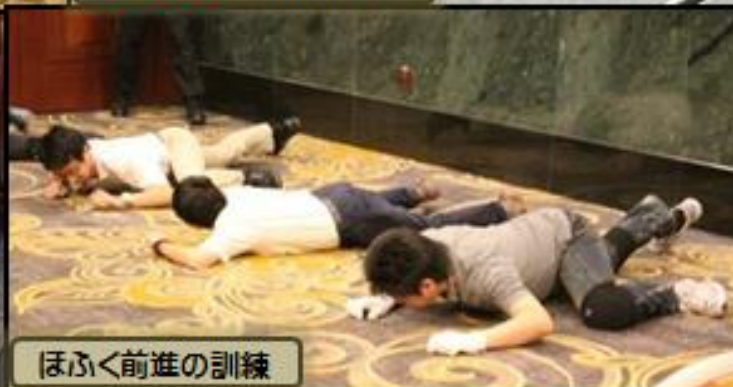
ほふく前進の訓練