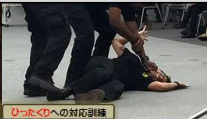
ひったくりへの対応訓練