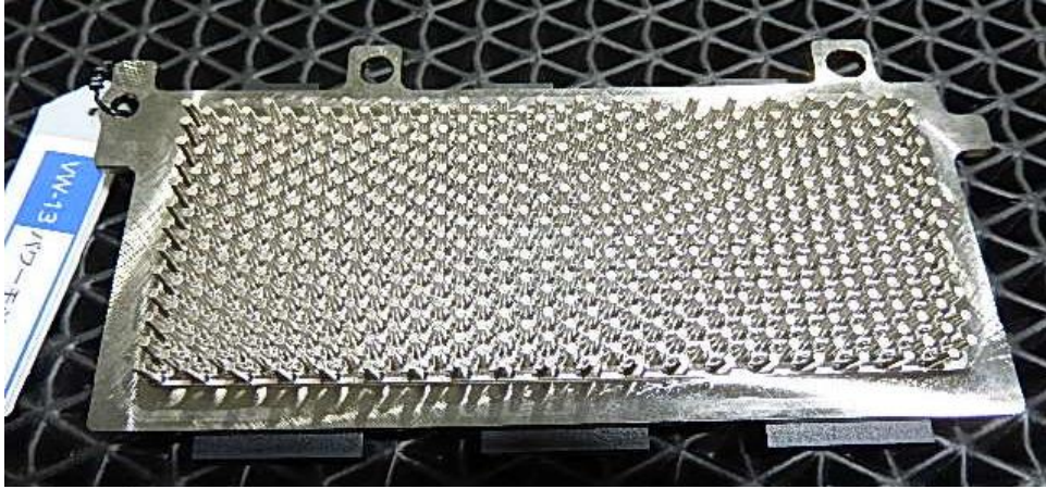
パワーモジュールブラケット