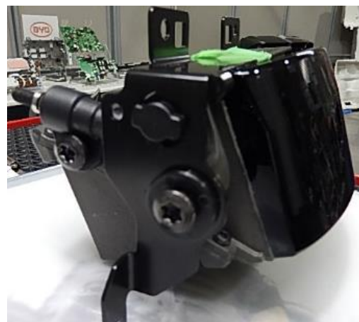
レーザー scanner の内部構造