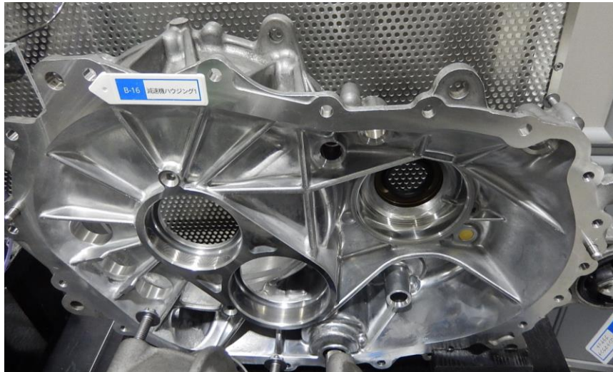
Tesla Model 3