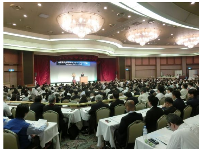
<フォーラム全体風景>