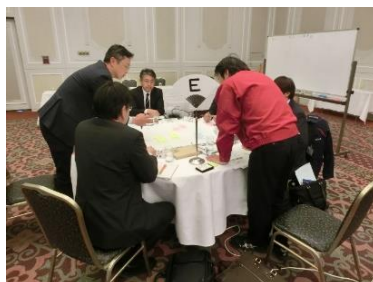
<グループディスカッション>